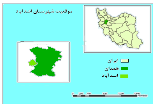
شکل (۱): نقشه شهر اسدآباد در تقسیمات کشور

شهر اسدآباد بین مدار ۳۴ درجه و ۳۵ دقیقه تا ۳۴ درجه و ۶۰ دقیقه عرض شمالی و ۴۷ درجه و ۴۷ دقیقه تا ۴۸ درجه و ۱۵ دقیقه طول شرقی قرار دارد. این شهر در غرب استان همدان و در همسایگی دو استان کردستان و کرمانشاه قرار گرفته است. این شهر از شمال به شهرستان قروه استان کردستان، از غرب به شهرستان‌های سنقر کلیایی و کنگاور از توابع استان کرمانشاه و از شرق به شهرستان‌های بهار و تویسرکان استان همدان محدود می‌شود مساحت شهر اسدآباد در سال ۱۳۹۱ حدود ۹۰۰ هکتار بوده است که در مقایسه با استان رقمی معادل ۶ درصد مساحت استان را اشغال نموده است. با توجه به جمعیت ۵۵۰۰۰ نفری این شهر (طبق سرشماری سال ۹۰) دارای تراکم نسبی ۶۱ نفر در هکتار می‌باشد. ارتفاع متوسط اسدآباد از سطح دریا ۱۵۸۵ متر است. از لحاظ تقسیمات سیاسی شهرستان اسدآباد دارای ۲ شهر به نام‌های اسدآباد و آجین، ۲ بخش مرکزی و پیرسلیمان، ۶ دهستان سیدجمال‌الدین، دربندرود، جلگه، پیرسلیمان، کلیایی، چهاردولی و ۹۹ روستای دارای سکنه است.