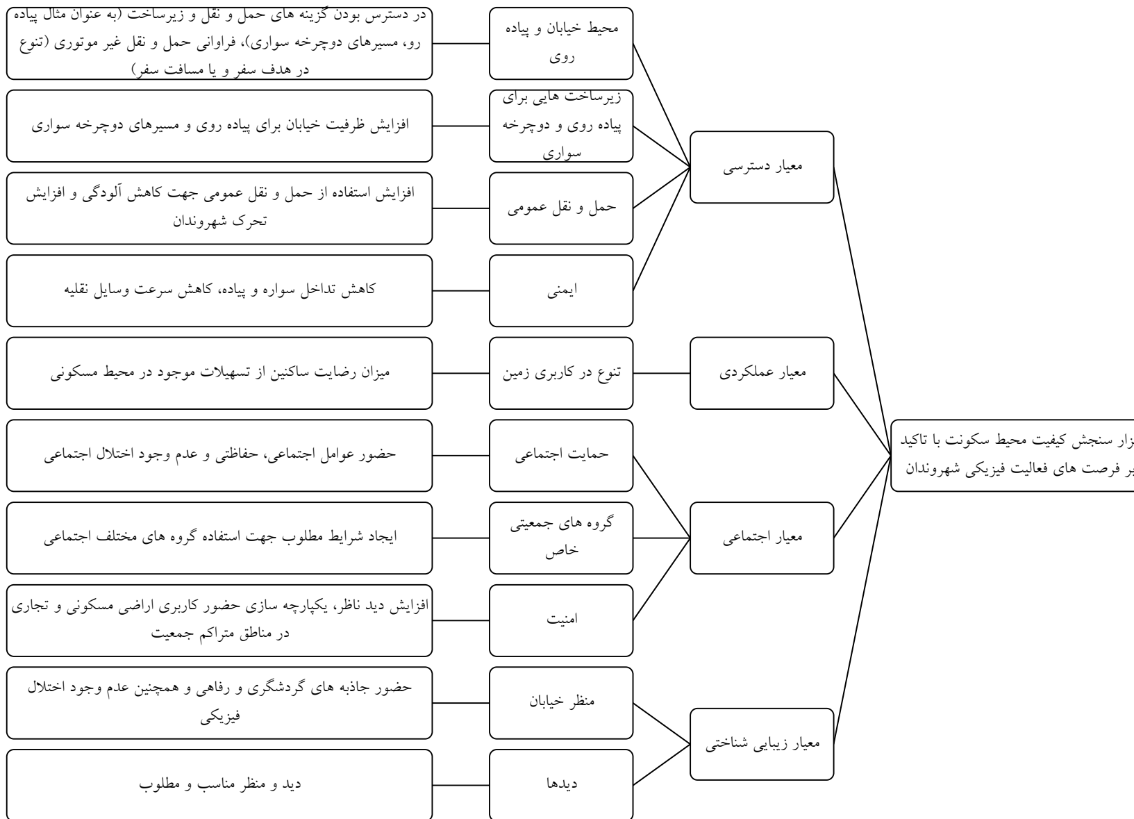
شکل (۱): مدل مفهومی پژوهش